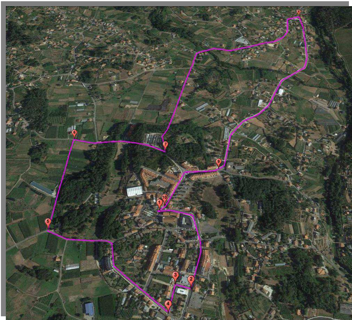
Percorrido de 5.142m

Percorrido de 5.142metros: Saída dende a Praza do Calvario en dirección Ramón Franco, Rúa do Couso, Rúa Nova do Couso, Rúa Casal, Rúa Jesús Noia, Estrada de Santa Ana, Camiño Gandarela, Estrada Morraceira, Rúa Campo da Feira, Camiño Pampaloas, Estrada a Fornelos Estrada a Loureza, Rúa Fornelos, Julios sexto e chegada á Praza do Calvario.